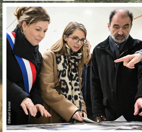
Photo : Mme RONCERET, députée, Mme BERGÉ, ministre déléguée, M. le Maire d'Ablis