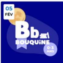
BB BOUQUINE : BALADE AU CLAIR DE LUNE