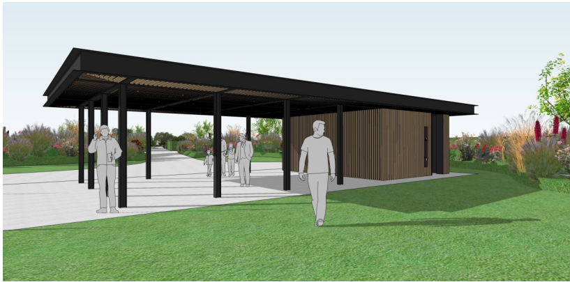
Auvent avec bloc sanitaire