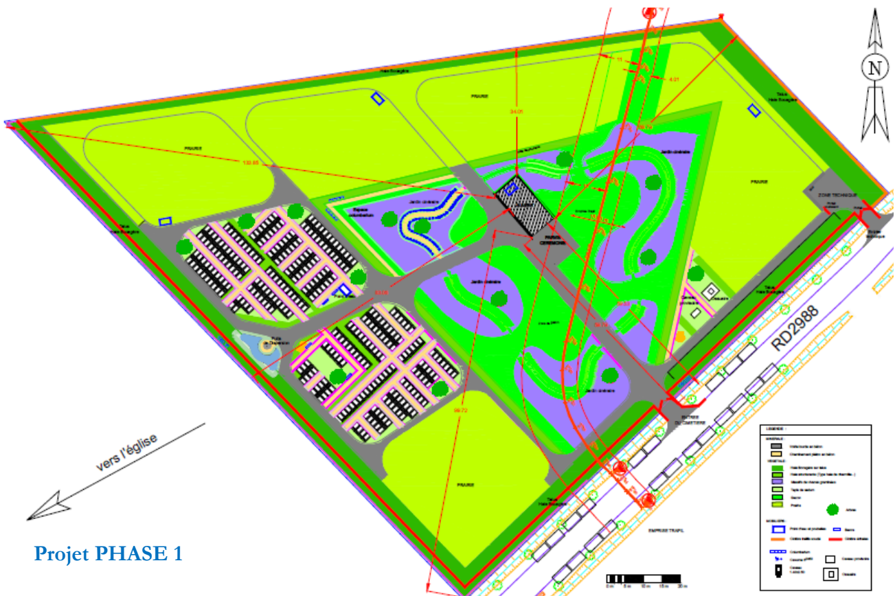
Projet PHASE 1